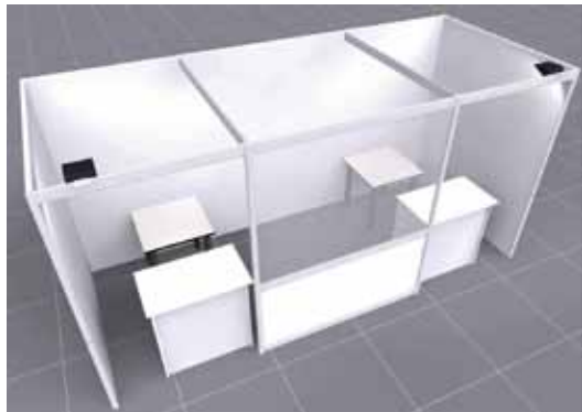
(2) area per due tatuatori da condividere 12mq (6x2)