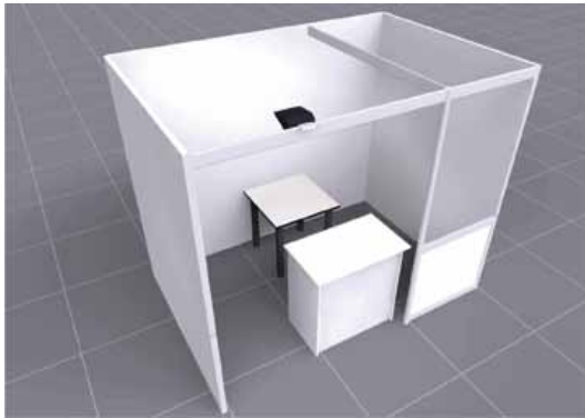
(1) area per singolo tatuatore 6mq (3x2) con plexi